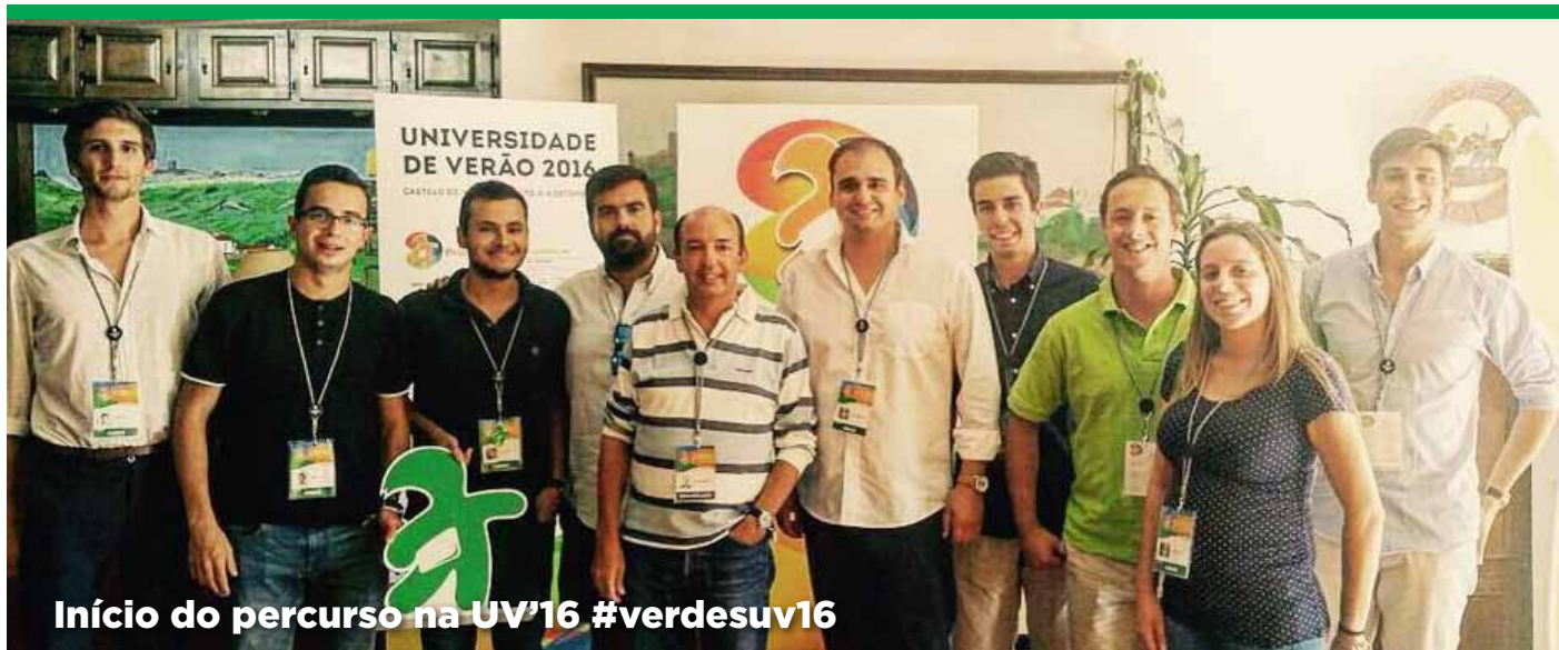
Início do percurso na UV'16 #verdesuv16

“Política: A grande porca” A política cheira mal? Nestes primeiros dois dias da UV assistimos a um enorme interesse relativamente a diversos assuntos políticos, que muito contrasta com a atitude da maioria dos jovens em Portugal, atitude esta que é aliás transversal a todas as faixas etárias da população portuguesa... falamos de um pessimismo crónico e na generalizada desconfiança face à política em Portugal.